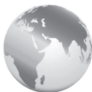
GLOBÁLNA PARTNERSKÁ DOHODA ALLATRA