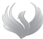
NIE NÁSILIU V RODINE A SPOLOČNOSTI

Ďakujeme všetkým dobrovoľníkom Medzinárodného spoločenského hnutia ALLATRA, ktorí sa vo svojom voľnom čase aktívne zapájajú do projektov. Tešíme sa z nových priateľstiev, nových nápadov a nových iniciatív! Pridajte sa k nám!